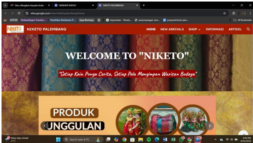
Gambar 4.1 E-Katalog berbasis Web

E-Katalog merupakan sistem informasi elektronik yang berisi daftar produk, spesifikasi, harga, serta informasi pendukung lainnya yang disajikan secara digital dan terintegrasi. Berbeda dengan katalog konvensional berbentuk cetak, e-katalog memungkinkan informasi produk diperbarui secara cepat, transparan, serta mudah diakses kapan saja oleh konsumen melalui platform online.